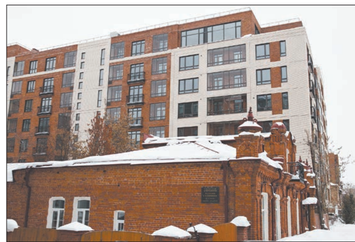
«Объект года» в сфере жилой недвижимости 2017 — ЖК MilkHouse

Развитие рынка коммерческой недвижимости Новосибирска в 2017 году сложно назвать бурным: девелоперы предпочитали завершать начатое и не