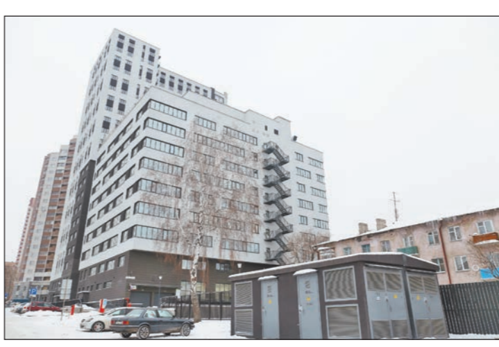
«Объект года» в сфере коммерческой недвижимости 2017 — комплекс MedPark

Два дома клубного типа расположились на месте бывшего молочного завода Danone. Отсюда и возникло название комплекса: в переводе с английского milk house — это «молочный дом». Напомним, что завод закрылся в сентябре 2014 года. В состав ЖК MilkHouse входят восьмиэтажный дом на 63 квартиры и девятиэтажный — на 104. Площадь варьируется от 51 до 251 кв. метра.