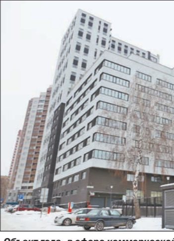
«Объект года» в сфере коммерческой недвижимости 2017 — комплекс MedPark